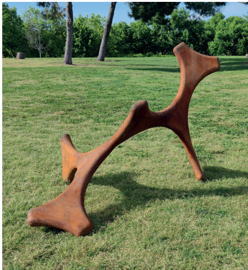
Gran Enroscada 7N

La iluminación de las esculturas por la luz natural o artificial, la pátina de color de las superficies, los reflejos luminosos de éstas; los cambios de esa iluminación multiplican los efectos visuales y espaciales en las mismas obras y en su entorno, como se puede apreciar en su instalación actual.