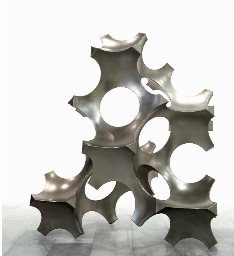
Gran Tetramorfo Biforma

Apreciar correctamente las obras de este artista y su relación con el entorno exige contemplarlas desde puntos de vista diferentes, ya que carecen, intencionadamente, de una visión frontal determinada, por lo que recomendamos vivamente desplazarse, sin prisa, a su alrededor; sin obviar las sombras sobre el suelo.